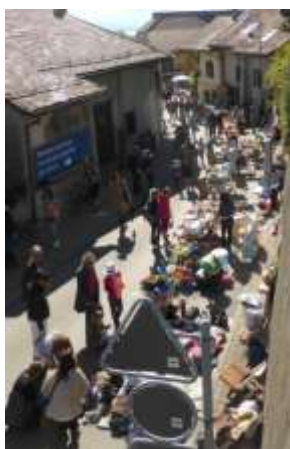
Les exposants à la Route de Duillier