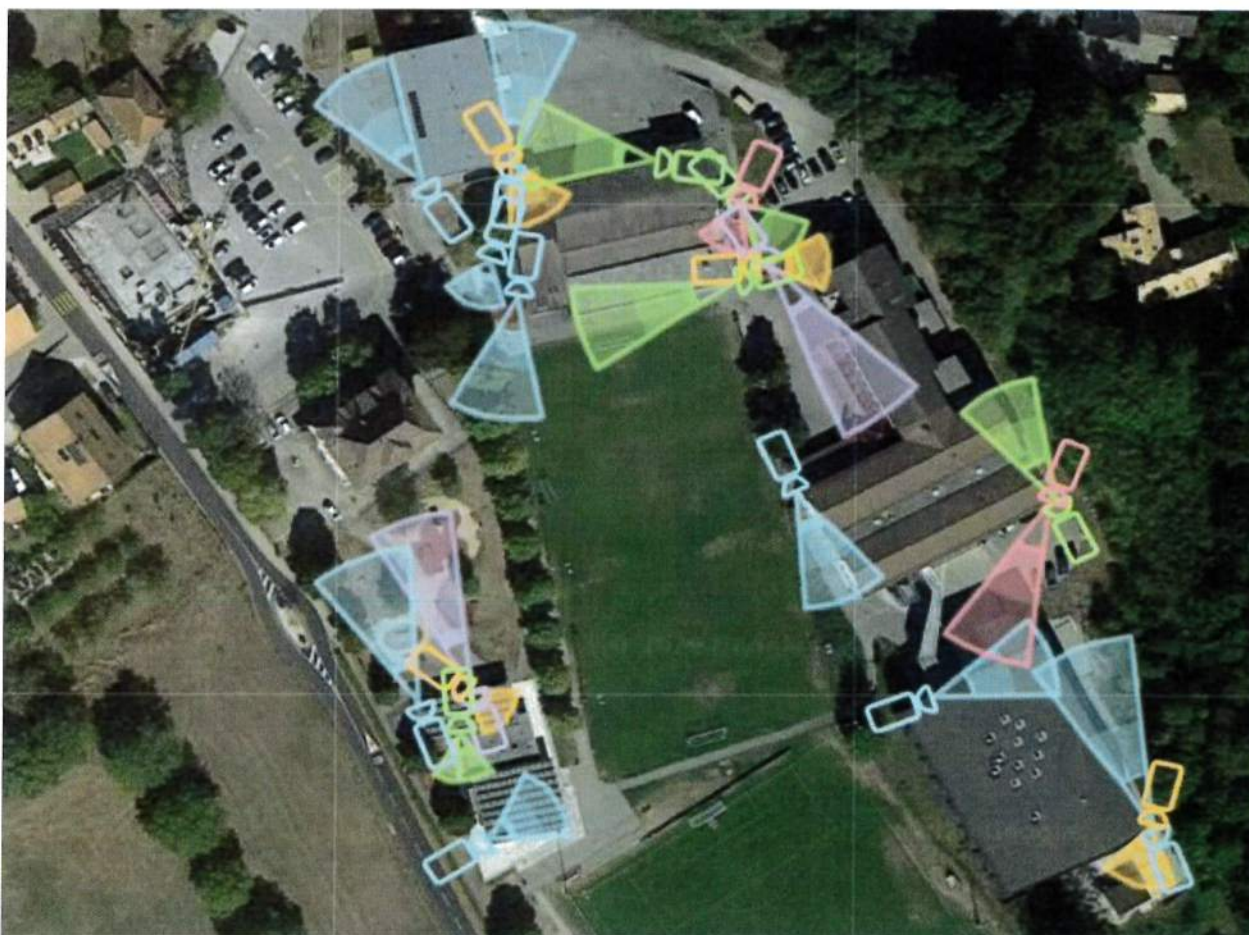
Figure 1 : Positionnement des caméras

Le plan ci-dessous, tiré de l'offre de Swisscom, montre la position des 22 caméras ainsi que leur champ d'action ; la moitié des caméras sera propriété de la commune de Genolier, l'autre moitié sera propriété de l'AISGE ; il est entendu que le remplacement d'une caméra défectueuse après la période couverte par la garantie de 2 ans sera à la charge de son propriétaire.