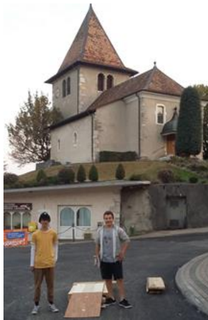
Place de jeux