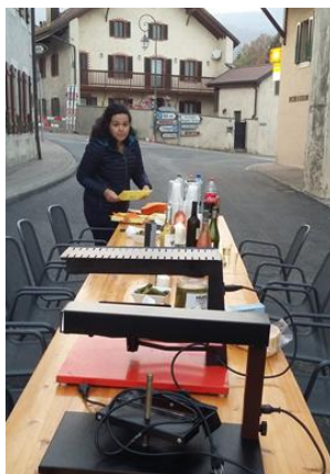
Place pour la raclette