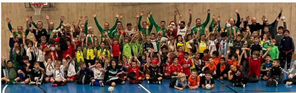
Ecole de Foot de Genolier-Begnins lors du tournoi de Noël du 8 décembre 2024