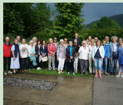
Sortie du groupe le 26 juin 2024, au Saut du Doubs

Le Groupe de Gym 60+ vous souhaite une bonne année 2025 !