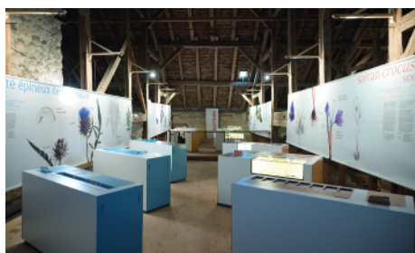
Exposition «Le Jardin dévoilé» (vue partielle)

Le Bois de Chênes, c'est toujours le patrimoine bâti au service du patrimoine nature, accompagné par le volet social via quelques activités sur le site. Le 4e élément, c'est la partie culturelle. En 2024, une exposition du Concours photos organisé lors de la Fête de la nature, et le transfert depuis le Château de Prangins de l'exposition Le Jardin dévoilé. Ce magnifique support didactique sera proposé aux classes d'école et présenté lors des prochaines manifestations.