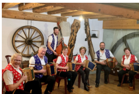
Petite formation au Moulin de Chiblins

Nous, membres de la petite ou de la grande formation, avons beaucoup de plaisir à laisser courir nos doigts sur les boutons de nos instruments pour animer, par exemple, le repas de Noël des aînés ou le 1 er août de Genolier, la cantonale à Givrins, la désalpe de Saint-Cergue ou encore les portes ouvertes des caveaux de notre région, etc.