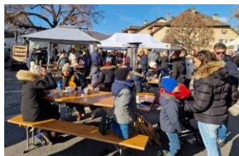
Beaucoup de monde au centre du village grâce à la fermeture d'un accès