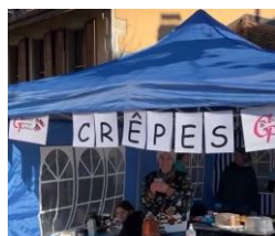
De quoi se remplir l'estomac