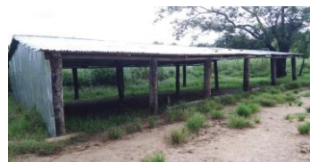
Abri scolaire actuel

Comme en 2021, le projet vise à construire un bâtiment scolaire pour 240 élèves de 4 à 11 ans dans le nord-est du Togo. Il s'agit de construire le même bâtiment inauguré le 27.07.2022 à Dapengo-Copé. En effet, dans cette région très retirée du Togo, les enfants de 6 villages doivent marcher environ 12 km pour se rendre à l'école à Kara. Pour cette réalisation, nous comptons sur des généreux donateurs. Comme par le passé, nous récolterons des dons devant la boucherie Prélaz le 23 et le 30 décembre. Avec l'aimable participation des commerçants du village et environs, nous proposerons divers produits et une soupe à la courge. Pour les dons, vous pouvez utiliser l'IBAN CH71 0900 00000 1235 4049 3 PostFinance, Pouguinimpo Foyeme Rouvinez ou par Twint au N° 079 467 12 11.