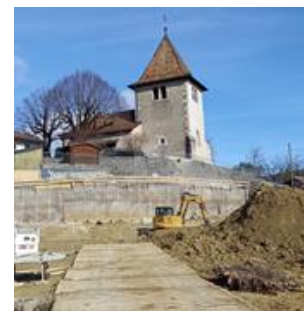
Un grand chantier peu connu du public se cache en dessous de l'église.