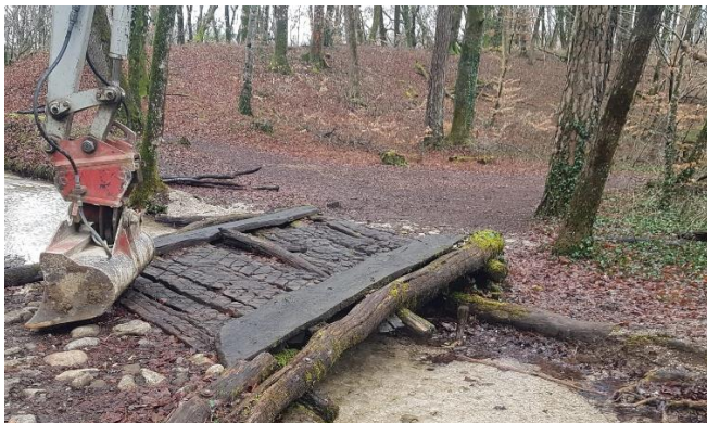
Avant - après