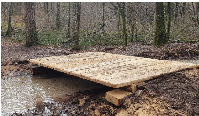
Le pont de La Baigne Aux Chevaux refait à neuf par le Groupement Forestier de La Colline