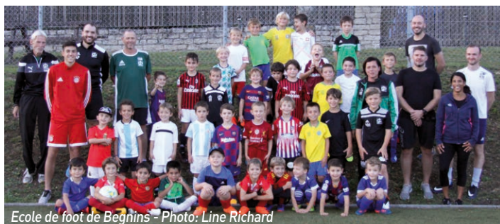
Ecole de foot de Begnins