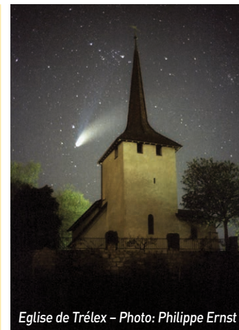
Eglise de Trélex

La restriction de rassemblement à 5 personnes a eu paradoxalement un effet positif. Au mois de novembre, nous avons remplacé les cultes par de multiples groupes de partage, le dimanche et en semaine, et même une fois par un jeu de piste en famille. Le culte ex cathedra limite la communication seulement du pasteur envers