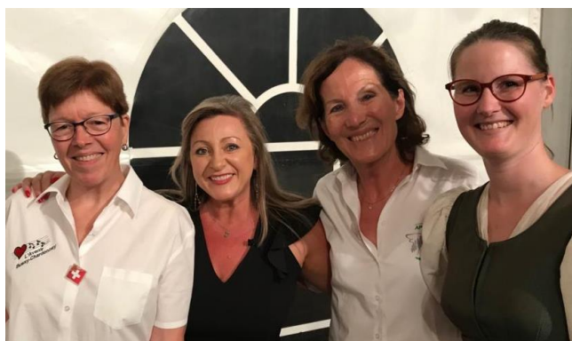
Madame la Présidente et les paysannes vaudoises !