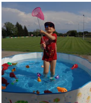
Animations de l'après-midi qui ont remportés un franc succès !