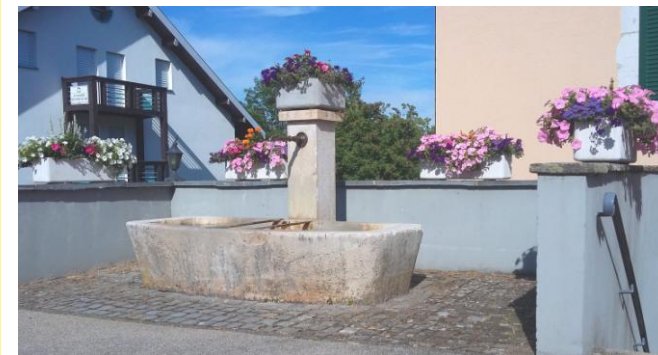
De l'eau et des fleurs