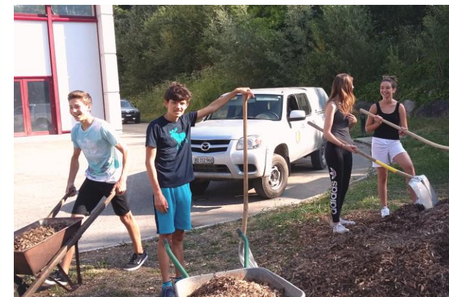
Dans la bonne humeur

Dès 8 heures, une quinzaine d'élèves de Genolier ont œuvré pour charrier et déposer des copeaux sur le chemin piétonnier qui va de l'école en direction du Bois de Chênes. Cette bonne action permettra de se promener également par temps pluvieux avec les pieds... presque au sec ! L'après-midi a été consacrée à la visite de la Station du Montant et d'écouter les explications de M. Blumenstein