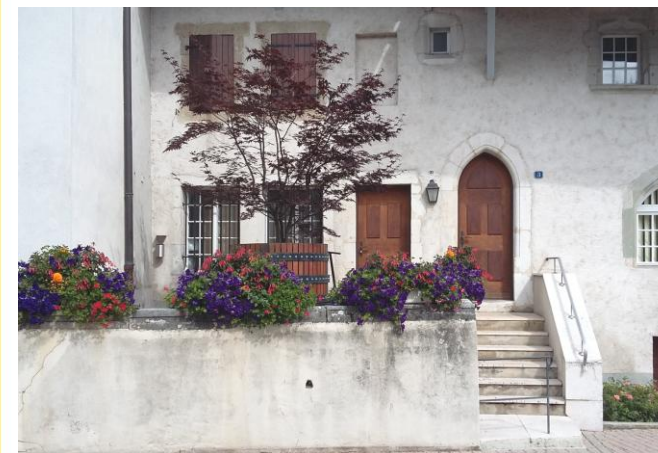
Une maison gothique de style