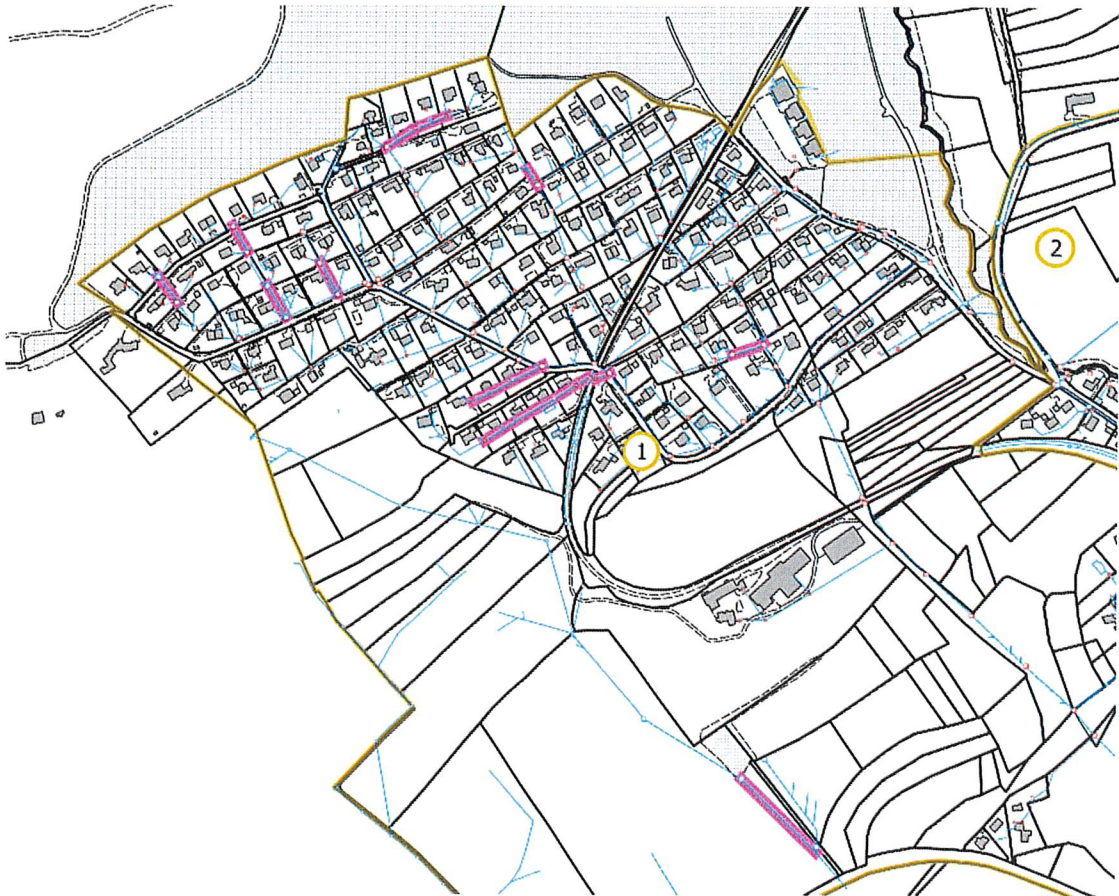
Figure 4 Fraisages

Ces curages permettent d'enlever les dépôts, les petites et moyennes racines et les couches de calcaire minces et récentes. Néanmoins, ils n'arrivent pas à enlever les grosses racines, les couches de calcaires durcies et les concrétions.