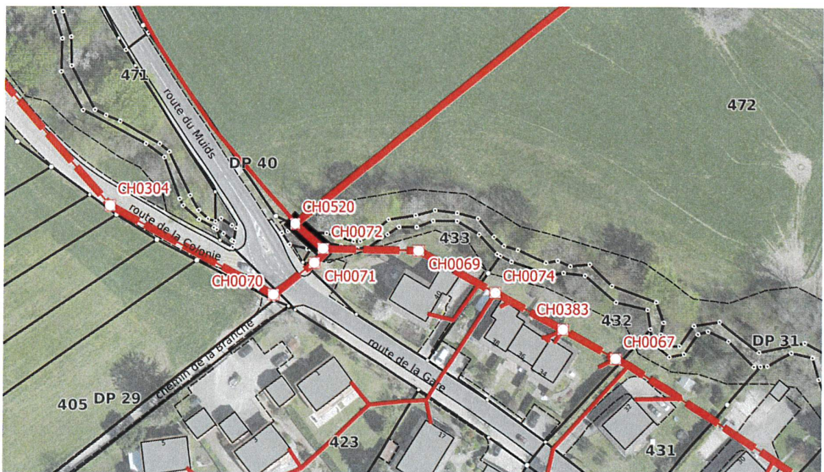
Figure 2 Route de la Gare

Les inspections de 2022 ont montré qu'un petit tronçon de collecteur situé à l'Est de la jonction de la route de la Colonie avec la route de la Gare, présente un assemblage déboîté. Cela implique une possible pollution du sol par des eaux usées à cet endroit à proximité du ruisseau de l'Oujon, sous lequel il passe.