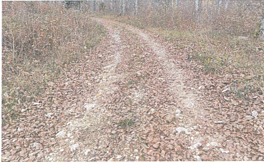
Vue sur le chemin dont la couche de finition a disparu et le coffre est déformé – Ilex – décembre 2022

Dans le massif des côtes de Genolier, la desserte forestière de la boucle de l'Oujon montre d'importantes marques d'usure au niveau de son coffre et de sa couche de couverture. Cette desserte est ainsi problématique pour le passage des engins forestiers et sa rénovation devient nécessaire pour garantir la bonne exploitation du massif forestier desservis.