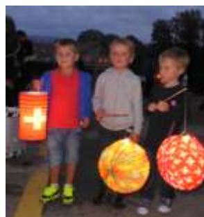
Avec les lampions